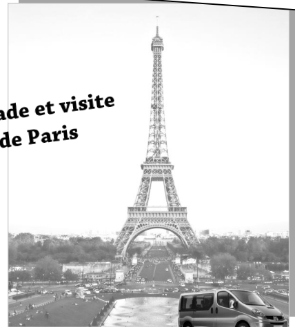
Transport en minibus