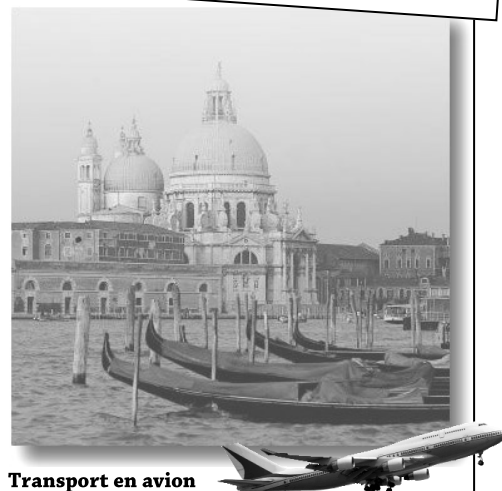
Transport en avion

(Place St Marc, Le Campagnile, Le Palais des Dodges, Grand canal, Le pont du Rialto, le pont Degli Scalzi, Le palais de la Ca d'Oro, Le pont des Soupirs, l'île de Murano et Burano...)